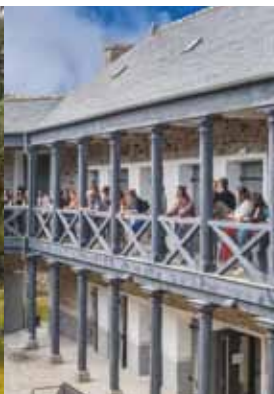
INSEAC : 80 étudiants inscrits pour la rentrée 2022-2023 / INSEAC : 80 studier enskrivet en adkrog-skol 2022-2023