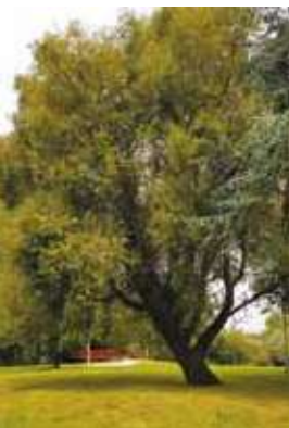
La prairie de Traouzac'h : site d'accueil de la future 5 e œuvre d'art / Pradenn Traouzac'h : lec'h degemer ar pempvet oberenn arz