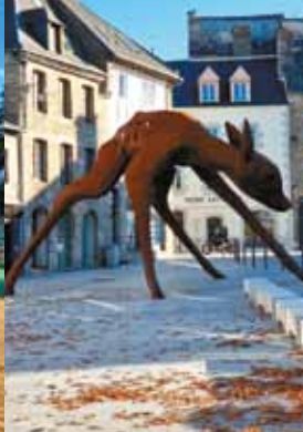
Une nouvelle place de la République avec l'œuvre d'art SITIS d'Alain Laboile / Ur blasenn ar Republik nevez gant oberenn arz SITIS Alain Laboile