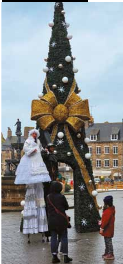
Animations de Noël place du Centre