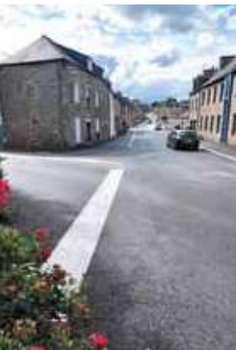
Réaménagement de l'entrée sud de la ville à Rustang / Adaozet toull-hent su kêr en Rustank