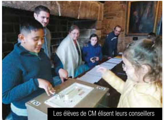
Les élèves de CM élisent leurs conseillers