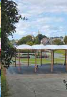
Création d'un nouvel équipement sportif à Cadolan avec un terrain de basket couvert / Savet ur framm sport nevez en Kadolan gant an dachenn basket goloet