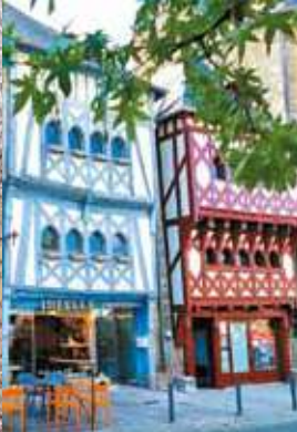
L'une des plus anciennes maisons à pans de bois de Bretagne entièrement restaurée / Unan eus koshañ tiez pastelloù koad Breizh renevezet penn-da-benn