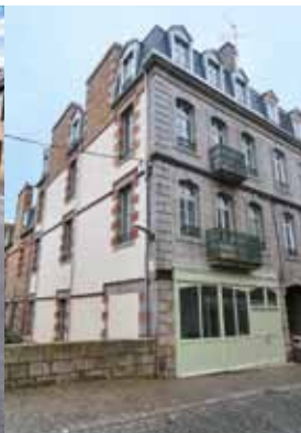
Restauration exemplaire par Guingamp Habitat de l'immeuble 27 bis rue des Ponts-Saint-Michel / Renevezet kaer-tre gant Gwengamp Annez ar mellad-ti 27bis straed Pontoù Lokmikael