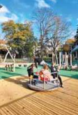
L'extension de Central Park prisée des enfants de tous âges / Astenn ar Central Park prizet gant bugale a bep oad