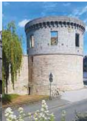
Suite de la restauration du château de Pierre II : sécurisation des tours et création de locaux tertiaires / Lec'h renevezadur kastell Per II : suraat tourioù ar c'hastell ha sevel lojerisoù-burev da feurmiñ

Le maire et le Conseil municipal de Guingamp vous présentent leurs meilleurs vœux pour l'année