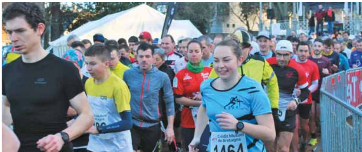
Galoupadenn dimanche 8 janvier