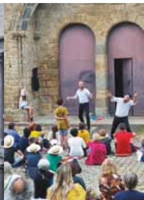
Guingamp, ville festive tout au long de l'année labellisée 100 % Éducation Artistique et Culturelle / Gwengamp, ur gêr festus hed-ha-hed ar bloaz gant al label 100% Deskadurezh Arz ha sevenadur