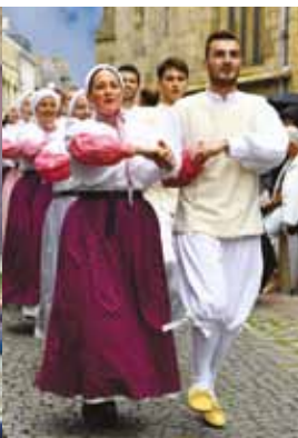
Guingamp, capitale de la danse bretonne avec le festival de la Saint-Loup / Gwengamp, kêr-benn dañs Breizh gant festival gouel ar Sant-Loup