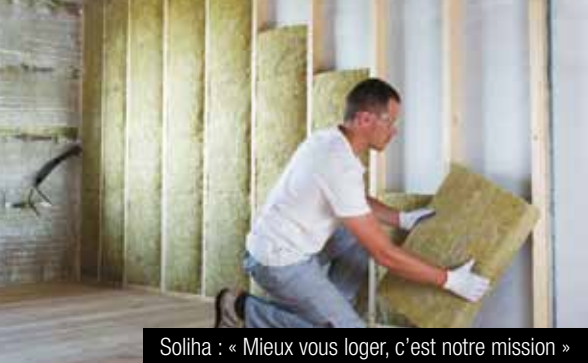
Soliha : « Mieux vous loger, c'est notre mission »