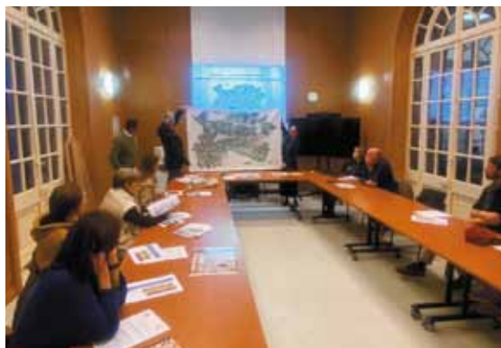
Remise du plan cavalier aux établissements scolaires