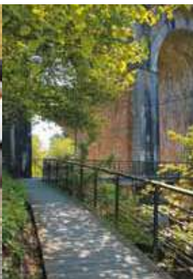
La création d'un nouveau cheminement sur la rive gauche du Trieux / Savet un hentad nevez war ribl a-gleiz an Tre