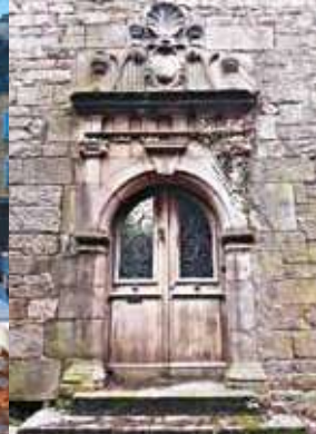
L'Hôtel de la Monnaie sauvé grâce à une 1 re tranche de travaux / Ostel ar Moneiz saveteet gant boulc'h kentañ al labourioù