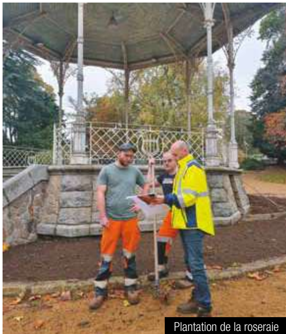
Plantation de la roseraie