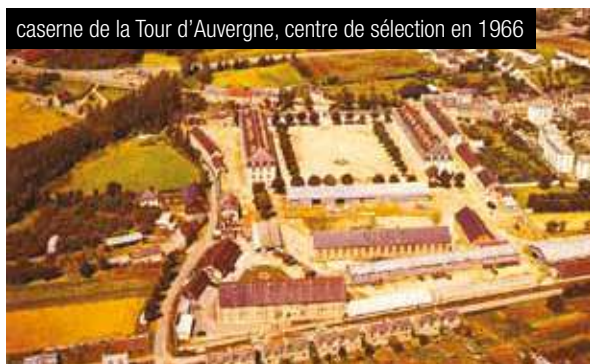
caserne de la Tour d'Auvergne, centre de sélection en 1966