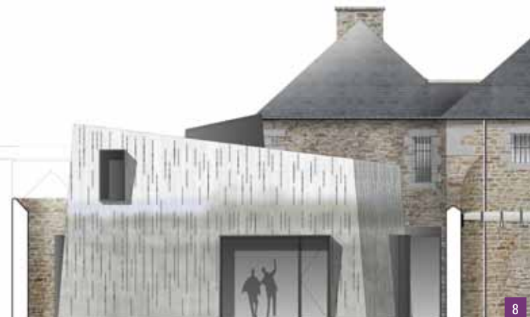
8. Extension contemporaine, salle d'exposition