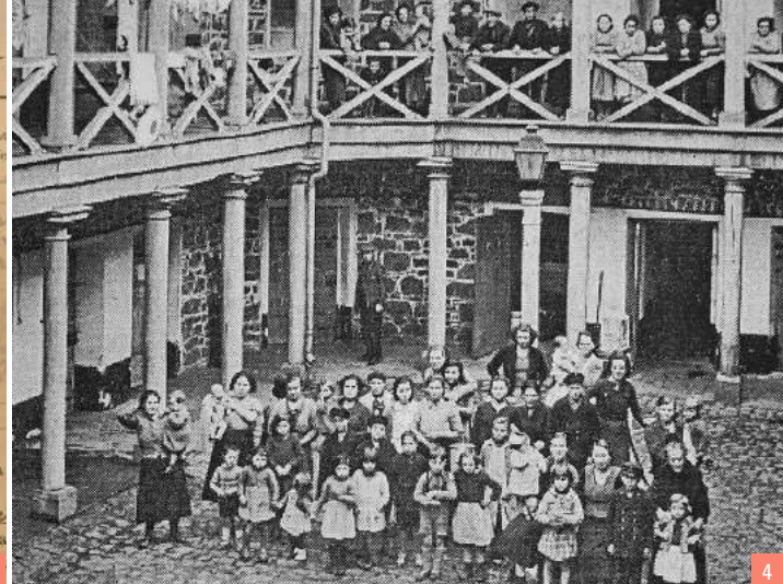
4. Réfugiés espagnols dans la cour de la prison