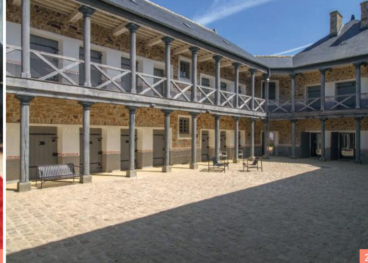
2. Cour centrale de l'ancienne prison